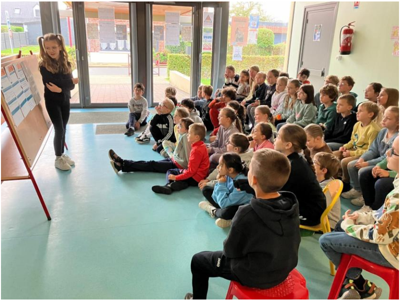
Conseil municipal des enfants