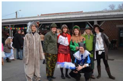
L'équipe... enseignante ?

Beaucoup d'enfants et de parents ont répondu présents pour le carnaval de l'école Pasteur. Les enfants ont débordé d'imagination pour ce défilé ensoleillé. Ils étaient déguisés en pirates, fées, clowns .... Et même les enseignants se