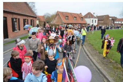
Défilé dans le village