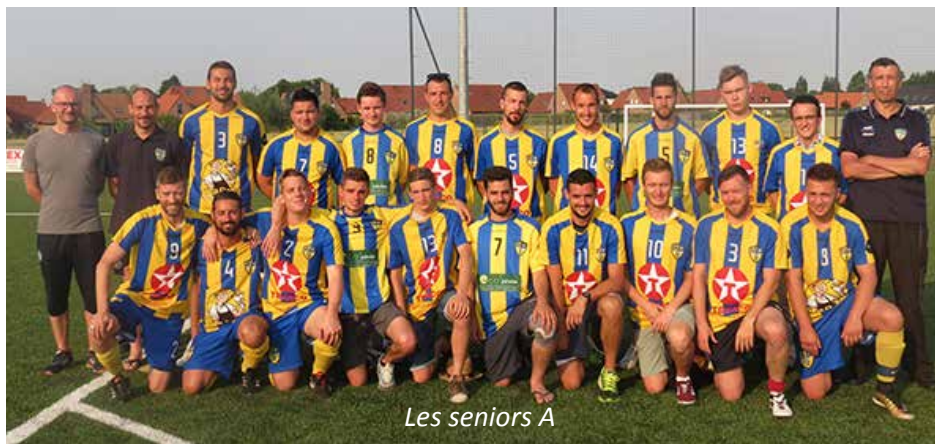
Les séniors A

La saison 2016/2017 vient de s'achever et au regard des résultats, l'ECC a vécu une saison exceptionnelle et se termine de la meilleure des manières avec la création de 3 nouvelles équipes en séniors féminines, U17 et U21 garçons. Les événements qui se sont succédés tout au long de la saison avec notamment le match de Coupe de France à Luchin, le goûter de Noël, l'augmentation constante du nombre de licenciés ainsi que les partenariats