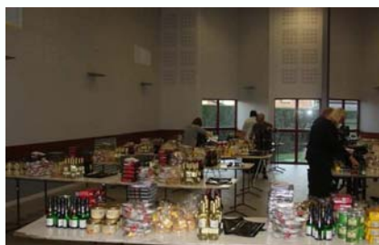
Les membres du CCAS au travail

Les personnes qui ne pouvaient se déplacer ont reçu la visite d'un membre de l'équipe qui leur a remis le colis en leur souhaitant un bon Noël, seules les personnes qui n'ont pas répondu pour la date fixée n'ont malheureusement pas bénéficié du colis.