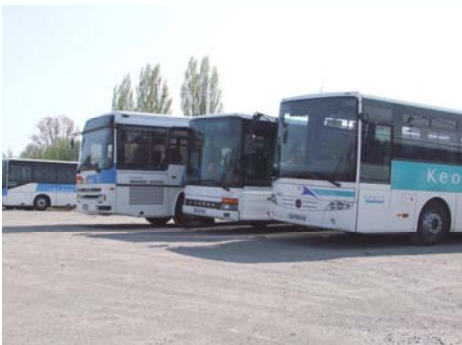
Le dépôt de bus actuel (rue de Cysoing)

Comme chacun le sait, c'est une préoccupation que l'on doit avoir car il conditionne aussi les emplois.