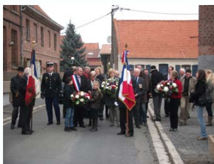
Départ du défilé

différentes générations sont capables de se rassembler, de se retrouver pour un hommage à ceux tombés pour la Patrie.