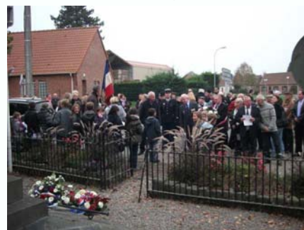
Les enfants participent activement

Cette année encore, la participation nombreuse et active des enfants des deux écoles de notre village a permis de donner à cette cérémonie d'hommage aux combattants morts pour la France une dimension émotionnelle importante. On ne peut donc que se féliciter de constater que le devoir de mémoire se perpétue dans notre commune et que